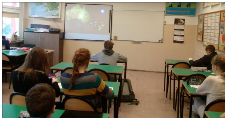
Uczniowie klasy 3 gimnazjum – zajęcia z wykorzystaniem gier językowych.